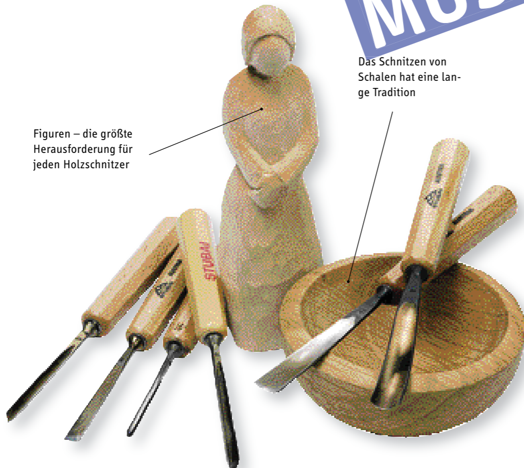
Das Schnitzen von Schalen hat eine lange Tradition